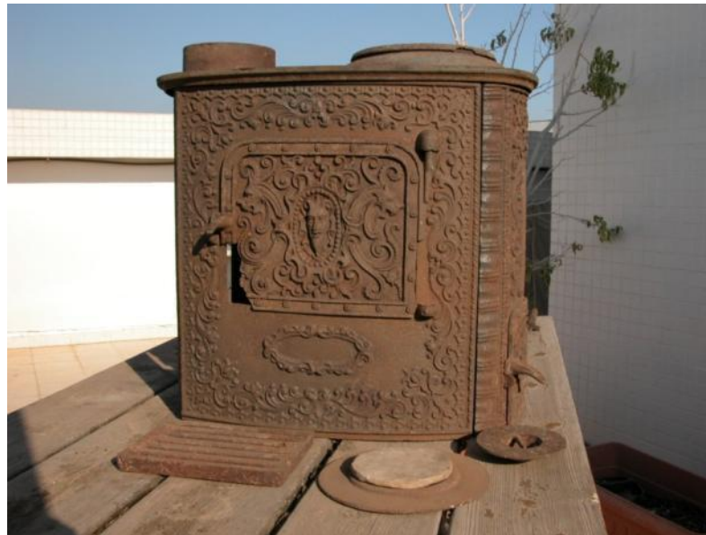
הרכבת התנור ללא רגליים