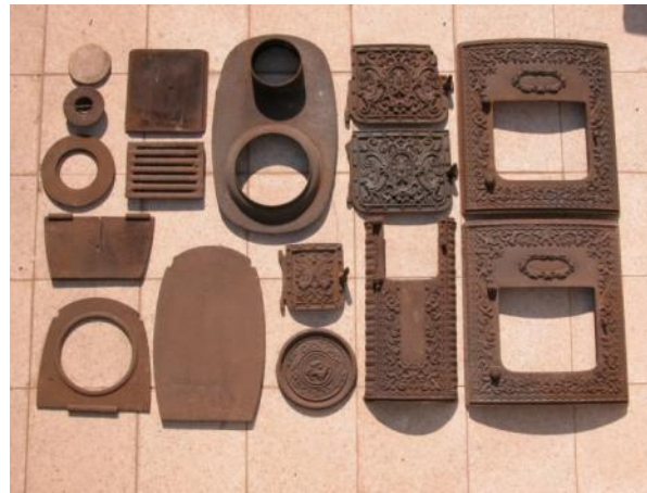
תנור מודלרי להרכבה עצמית