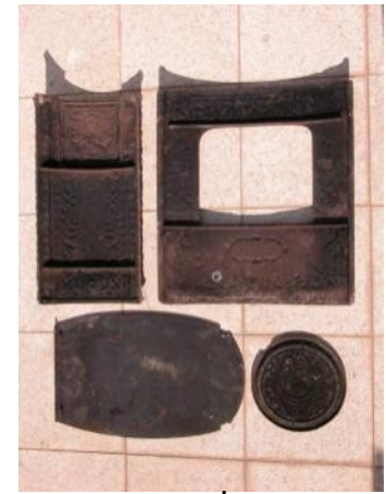
פיח בחלקים פנימיים