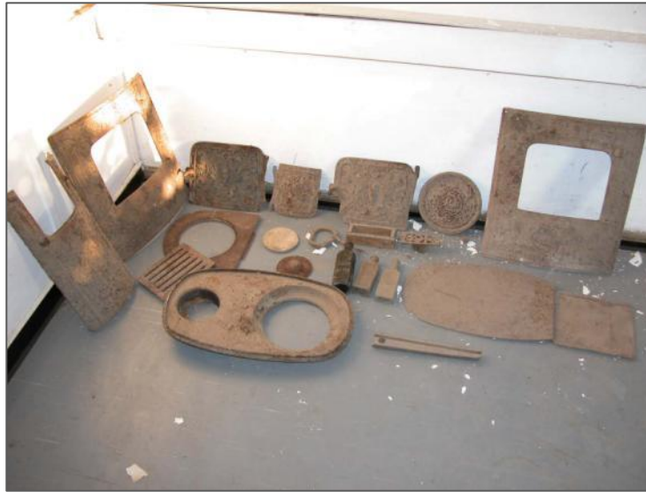
דלתות התנור נמצאו עם צירים שבורים