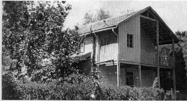
The old Wennagel house, first house in Sarona, built by Johann Martin Wennagel 1871/72. Photo taken circa 1938

נבנה בשנת 1872 במושבה הטמפלרית שרונה רח' מנדלר 9 הקריה תל-אביב